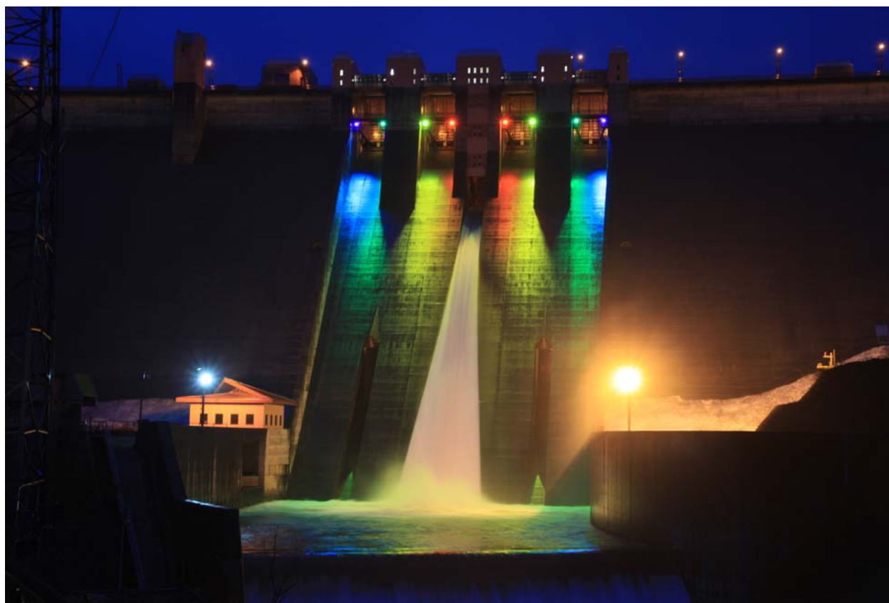
浅瀬石川ダムのライトアップ

◆放流時間 9時30分～11時30分、13時30分～17時00分 (両日ともに、1日2回)