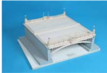
作品名 納屋橋 青森県立尾上総合高等学校 エコロジー系列