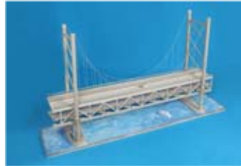
作品名 明石海峡大橋 山形県立長井工業高等学校 環境システム科