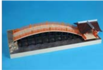
作品名 巖島神社 反橋 秋田県立大館工業高等学校 土木・建築科