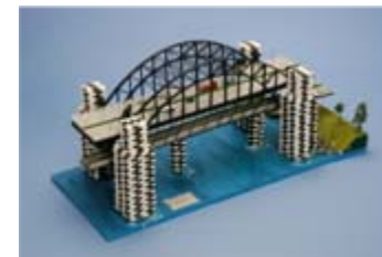
作品名 カラスアーチ橋 福島県立福島明成高等学校 環境土木科