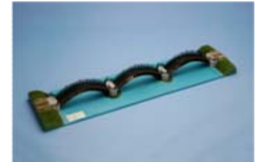
作品名 三連の雁橋 山形県寒河江工業高等学校 土木科