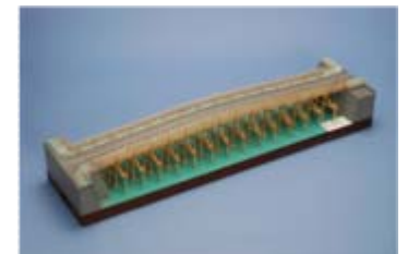
作品名 渡月橋 宮城県上沼高等学校 農業技術科