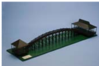
作品名 鶴の舞橋 山形県立寒河江工業高等学校 土木科