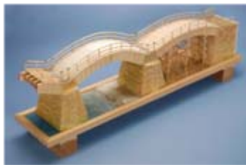
作品名 錦帯橋 山形県立長井工業高等学校 環境システム科