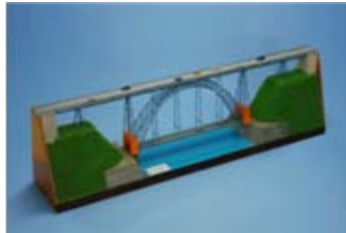
作品名 ドン・ルイス一世橋 宮城県上沼高等学校 農業技術科