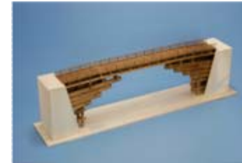
作品名 猿橋 宮城県古川工業高等学校 土木情報科