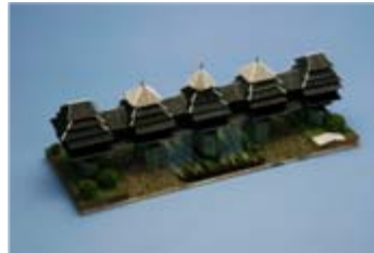
作品名 中国の風雨橋 宮城県迫桜高等学校 総合学科エンジニアリング 系列土木