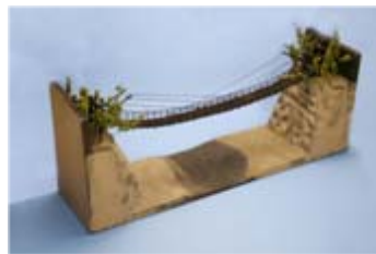
作品名 かずら橋 仙台市立仙台工業高等学校 土木科