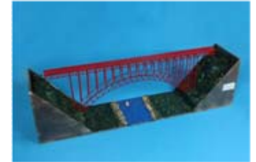
作品名 ニューリバーゴージ橋 宮城県古川工業高校 土木情報科