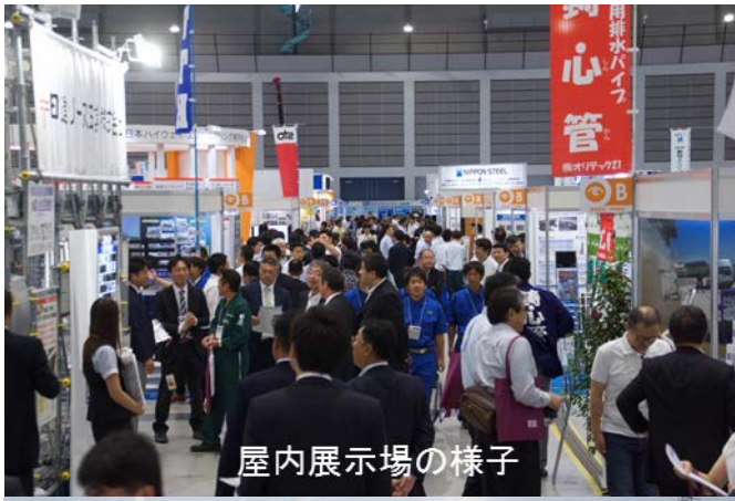
屋内展示場の様子