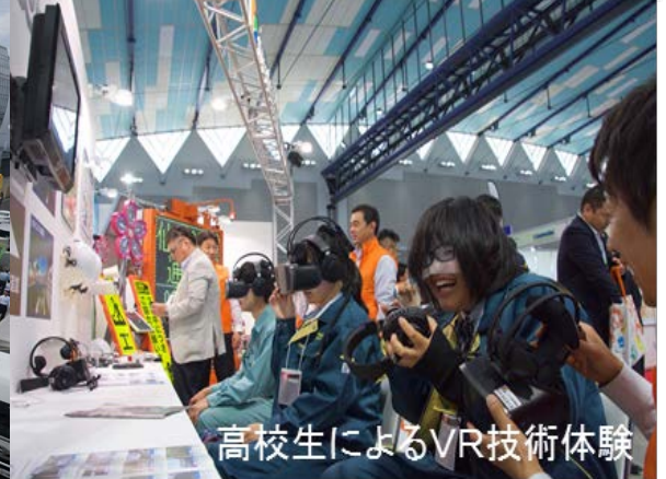
高校生によるVR技術体験