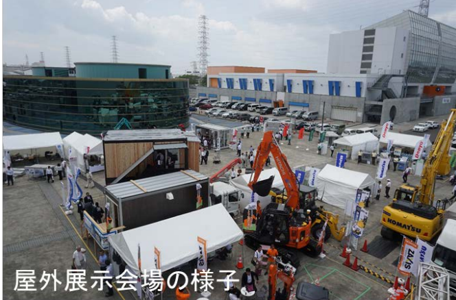
屋外展示会場の様子