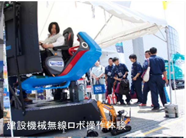
建設機械無線ロボ操作体験