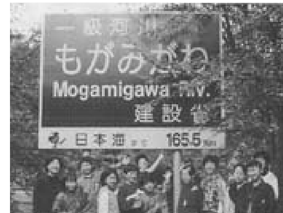
最上川229キロ探検の旅

普段知っていると思っていた水の不思議な性質や川に携わってきた歴史的な人物の話、最上川の水質の話など教科書からでは、なかなか知ることの出来ない話に興味を持っていただき、いろいろな面から最上川や水を考えるきっかけづくりができました。