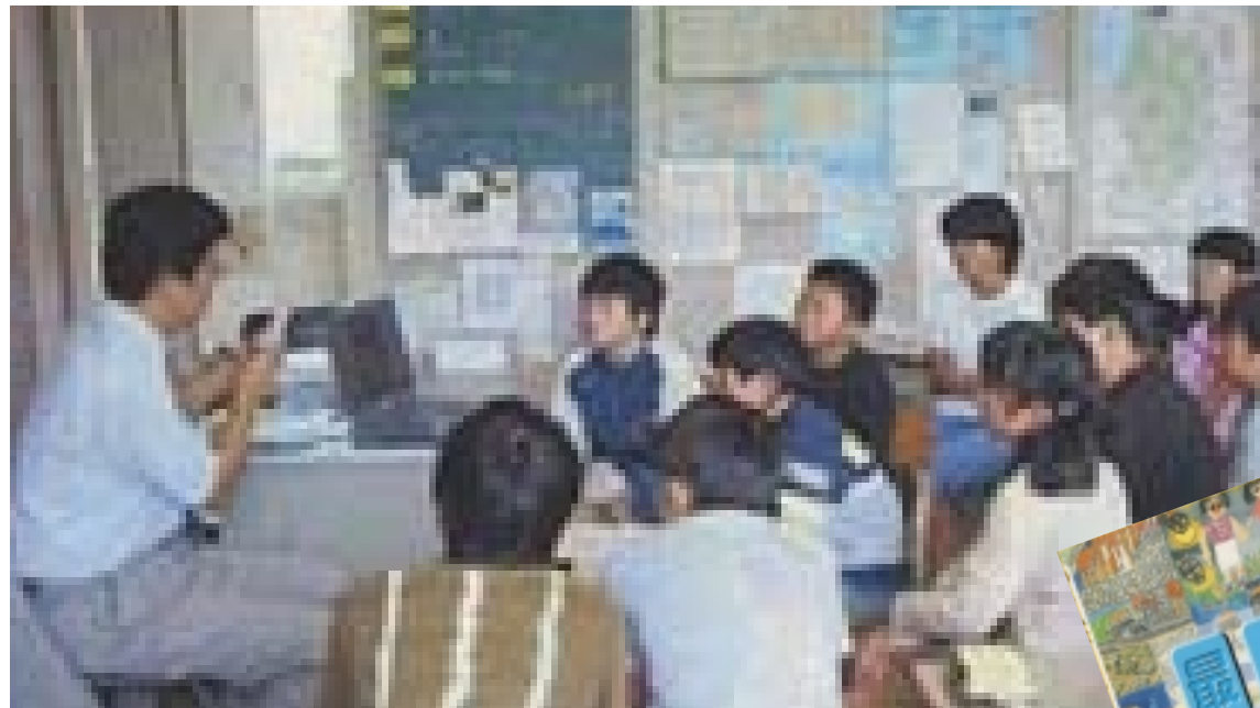
出前講座の実施状況

社会学習の事前学習として、水の循環や水の科学、最上川の歴史(治水・利水・環境・舟運)、水質、川に携わる方々(観測員、操作員)など、副読本「わたしたちの最上川」を用いて、簡単な説明と質問に答える形での講座を実施しました。