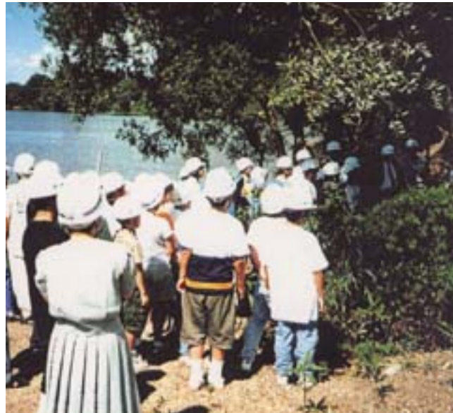
カブト虫の取り方を教わっています