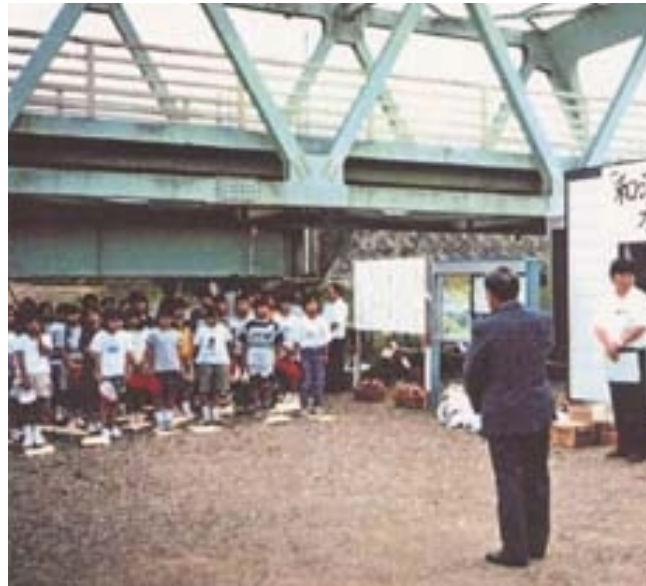
川での遊び方を学びました

北上川についてや川での遊び方、国土交通省の仕事について、わかりやすく説明しました。また、北上川の汚れの原因や汚れを防ぐための手立てについても講義を実施。これらの説明をふまえ、川の汚染の原因を調査する計画(どんな調査項目をどのような調査方法で行うかなど)を一緒に立てました。