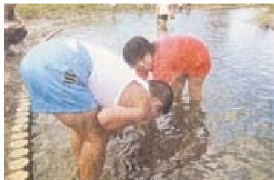
みずべの学習広場で自然に親しむ子供たち