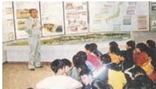
「たままつ海の情報館」で見学会の説明