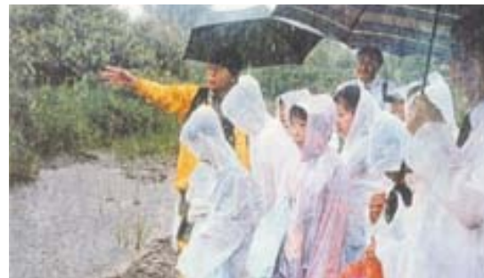
雨の中行った自然観察会