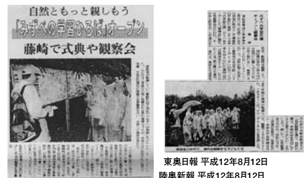
東奥日報 平成12年8月12日 陸奥新報 平成12年8月12日