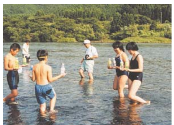
笛の合図でゲーム開始