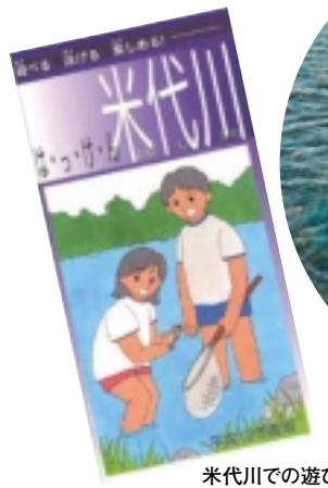
米代川での遊び方を解説しているガイドブック『はっけん米代川』

川が少し汚い！と思、たけど、『はっけん米代川』には「泳げる水質」と書いていて、少し安心した。それに魚もたくさんいて、(魚もたくさんいて)すごいと思、た。 これで、少しは生き物が好きにな、たかな(?)という気がします。