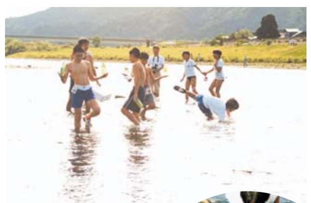
みんなで魚とり。たくさんとれたかな？