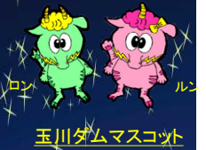
玉川ダムマスコット