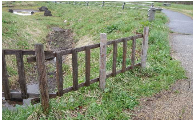
○杭2本を取り替え打ち直しました