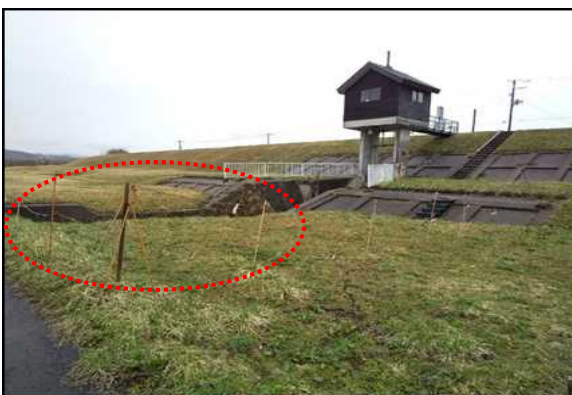
●立入禁止ロープが損傷