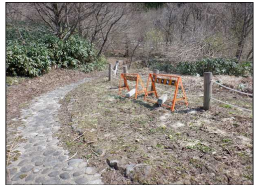
○補修までの間バリケードを設置しました