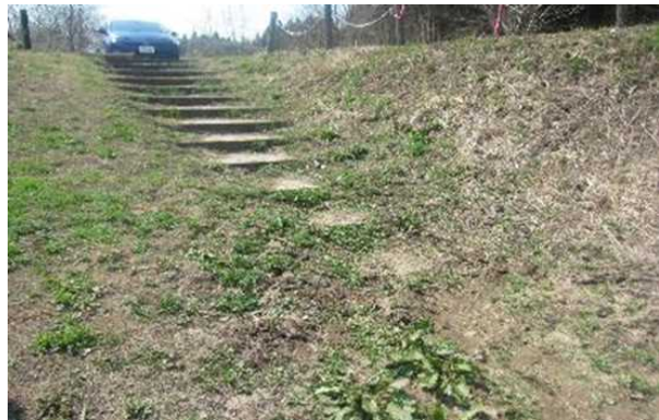
●遊歩道階段に土砂堆積