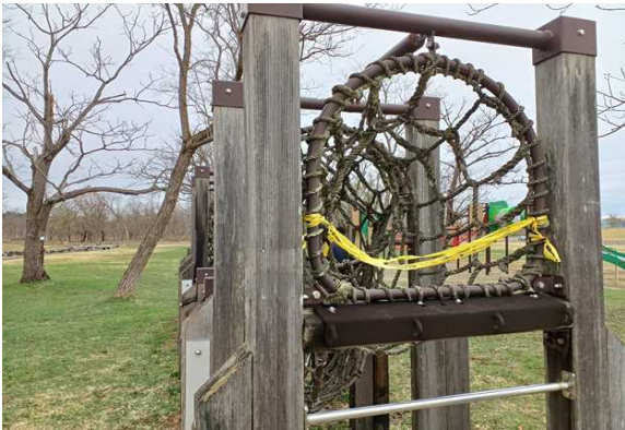
●使用禁止テープの劣化