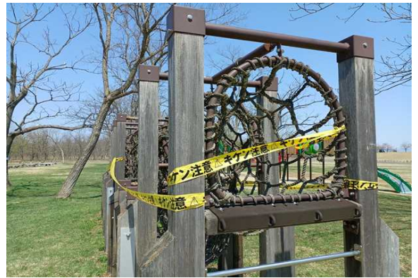
○テープを貼り直しました