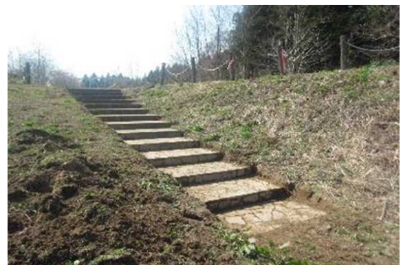
○土砂を撤去しました