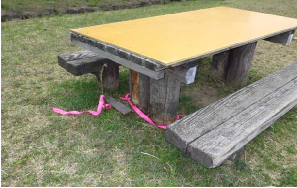
●テーブル・ベンチのがたつき