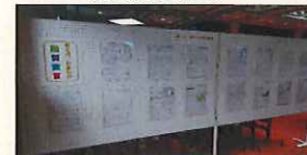
私たちの防災宣言