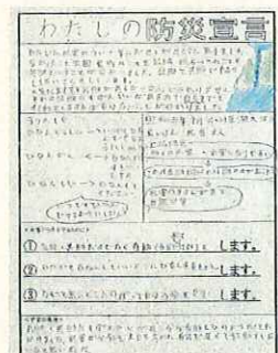
私たちの防災宣言から

協議会では平成31年度以降、流域内関係市町村での水防災教育の実施拡大を目指し、今回の授業で得られた結果を基に普及に努めます。