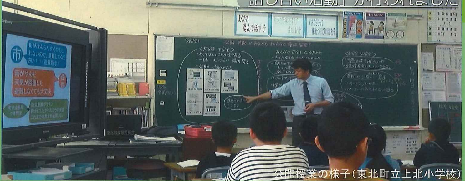
公開授業の様子(東北町立上北小学校)