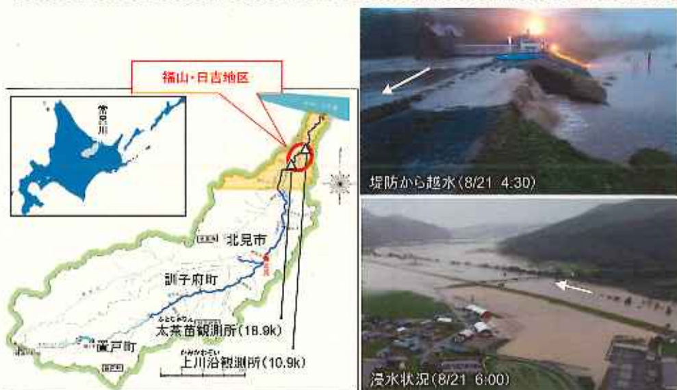
※これは速報であり、数値等は今後変わることもあります。

8月20日からの台風に伴い、常呂川では下流の北見市常呂自治区(福山・日吉地区)にて4箇所の越水が発生するなどにより、約215haの浸水被害が発生。