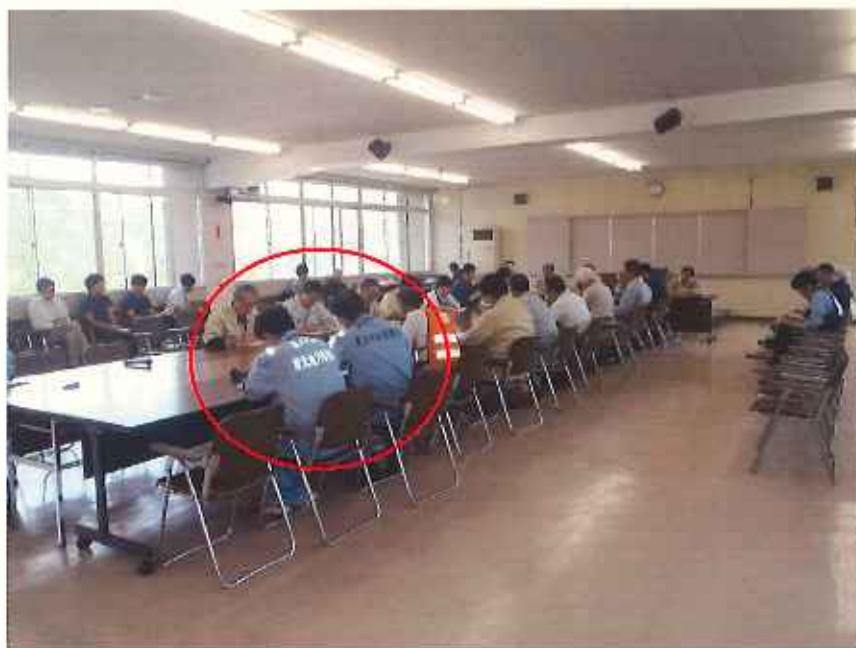
岩泉町へのリエゾンの派遣(H28.9)

市町村からの要望など、仲介する役割もリエゾンが担います。 なお、青森県内全ての40市町村と協定締結しています。