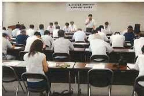
台風第10号の接近前に関係者35名が集まった臨時幹事会(H28.8.26: 山形河川国道事務所)