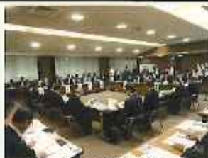
協議会の開催状況