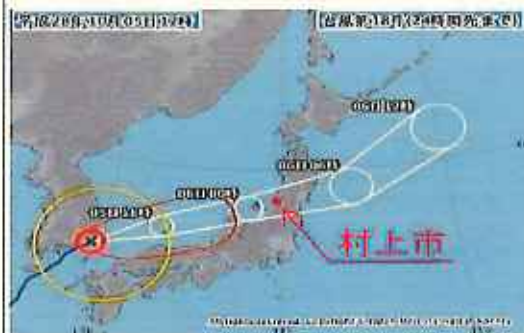
村上市に台風が深夜直撃する予想進路