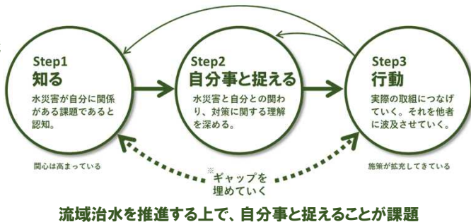
流域治水を推進する上で、自分事と捉えることが課題

水災害から自身を守ることからさらに視野を広げて、地域、流域の被害や水災害対策の全体像を認識し、自らの行動を深化させることで、流域治水の取り組みを推進する。 ※流域治水に取り組む主体を増やす(自分のためから、みんなのために)