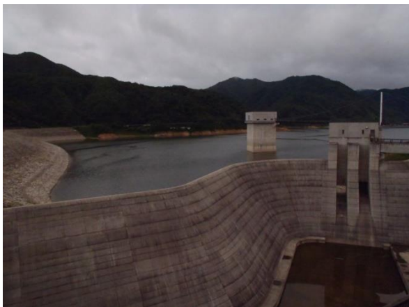
降雨開始から貯水池の水位が約5.5m上昇しました。