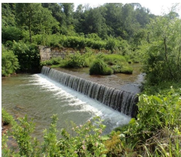
苦水川溪流保全工