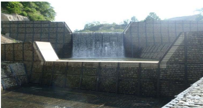
横道沢第5砂防堰堤