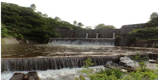
苦水第一砂防堰堤

国道47号新庄市本合海地区の最上川に架かる本合海大橋の信号T字路を国道458号に曲がり肘折温泉に向かいます。大蔵村に入り、最上川に掛かる大蔵橋を渡ります。本合海大橋信号T字路から、国道458号約19km先のトンネルを抜けた右折し、肘折温泉にいきます。温泉街で銅山川と苦水川が合流しています。合流点から苦水川沿いに上流に向かい、カルデラ温泉があります。すぐそばに苦水第一砂防堰堤があります。