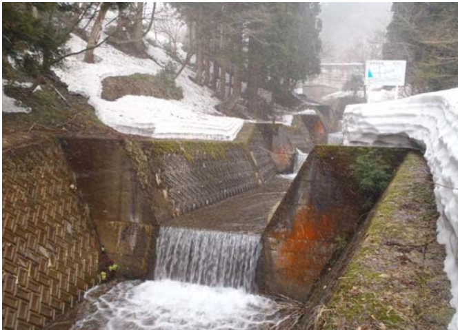
科沢川砂防堰堤+流路工