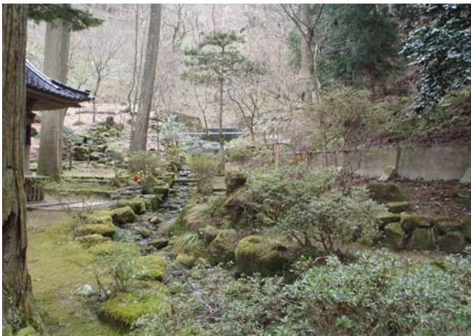
龍王沢川砂防堰堤+流路工

県道38号より西側、善宝寺の「お水取り」が行われる貝喰の池に注ぐ溪流に修景砂防で設置した砂防堰堤及び流路です。