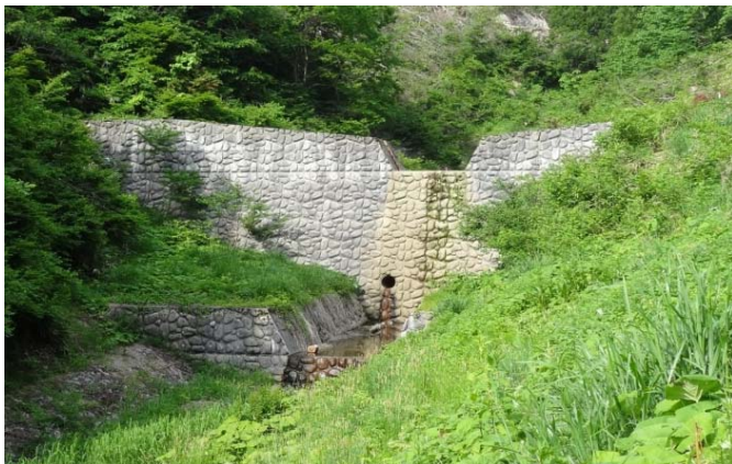
堰の上沢砂防堰堤

山形・新庄方面から行く場合は、中田地区の無料高速道路入口を右折し、国道13号へ入り、2.2Km先右側にコンクリート舗装の坂道があります。その上250m先に玉石模様の堰堤があります。