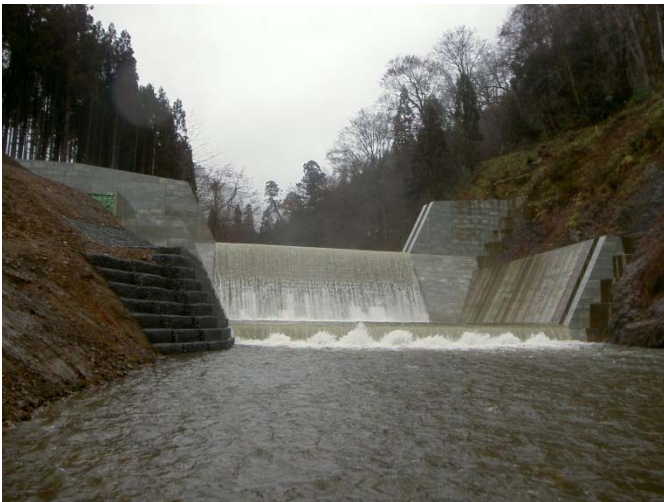
八敷代川第3砂防堰堤

国道13号を湯沢方面に向かい県道35号に入り約11km進むと八敷代橋があります。その橋の手前を右折し約1.8km先にある橋の上から堰堤と堰堤に行く道路が見えます。