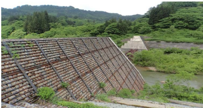
日陰倉第2砂防堰堤

国道47号新庄市本合海地区の最上川に架かる本合海大橋の信号T字路を国道458号に曲がり肘折温泉に向かいます。大蔵村に入り、最上川に掛かる大蔵橋を渡ります。本合海大橋信号T字路から、国道458号約12.6km先T字路右折し、村道1.0km先T字路右折し、約0.8km先に日陰倉第二砂防堰堤があります。