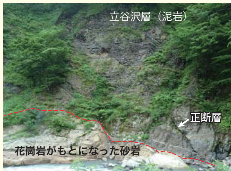
潜岩砂防堰堤の下流で見られる地層

ここでは、日本列島がユーラシア大陸から離れたときの大地、いわば出羽丘陵の「底」が見えているのです。