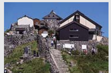
月山頂上の月山神社