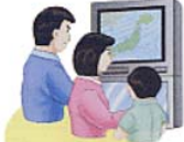
天気予報、台風情報等に注意しましょう。

土砂災害の多くは雨が原因で起こります。1時間に20ミリ以上、または降り始めから100ミリ以上になったら要注意！