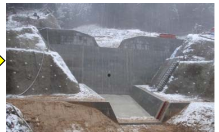
第1砂防えん堤完成