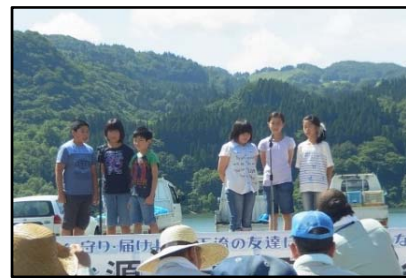
西川小学校児童による水源地宣言