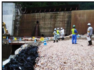
砂防堰堤工事現場(志津)