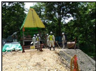
集水井工事現場(志津)

8月28日(木)、村山地区の2出張所(大石田・寒河江砂防)と、それぞれの工事を担当する施工業者とが合同で「第1回村山地区安全パトロール」を実施しました。当日は工事現場や現場事務所を点検した後、検討会が行われ、各現場の良かった点、改善すべき点の報告や今後の改善策について話し合われました。