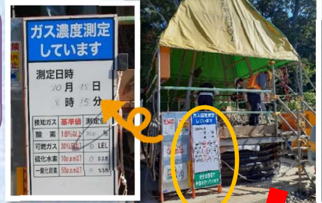
集水井(井戸)を掘削中

深い井戸の中で作業をしているから、酸欠事故を防ぐためには、ガス濃度の測定が大切なんだね。