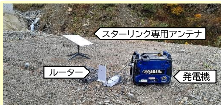
↑通信に必要な道具はこれ(+スマホ)だけです