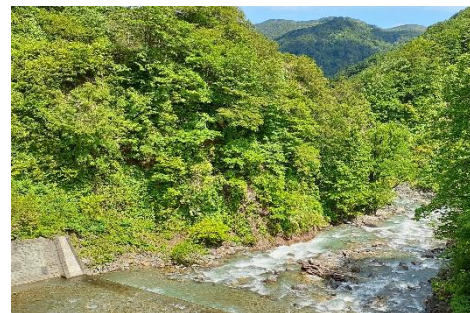
早春の本沢 [本沢第1砂防堰堤] (2022.6)