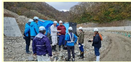
↑手軽さ、便利さを説明する現場見学会も実施

松沢は電波の入らない山中にありますが、スターリンク(衛星インターネットサービス)を導入したことでインターネット通信ができるようになりました。これにより日常的な業務の効率化はもちろん、これまで時間がかかっていた緊急時の連絡が迅速にできるようになり、砂防工事の安全性が大幅に改善されました。