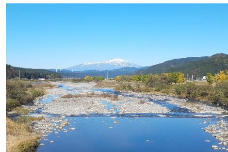
流路工と鳥海山、風車 [流路工下流] (2023.11)

遠方にお住まいの方、なかなか足を運ぶ機会がない方にも 四季折々の景観をお楽しみいただけます