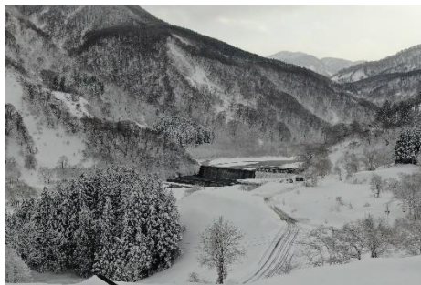
六瀨砂防堰堤・冬 [六瀨砂防堰堤] (2022.2)