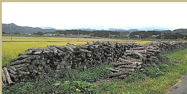
戸沢村（岩清水堤防）