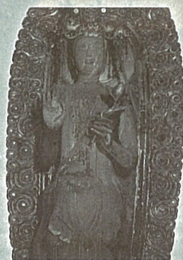
ご本尊(秘仏) 庭月聖観世音菩薩立像 今から約1100年前 慈覚大師円仁の御作。比叡山延暦寺横川中堂観音様式を今に伝え、全国的にも貴重な平安仏。

当山・庭月観音は最上三十三観音打ち止め満願の寺として多くの善男善女の篤きご信心をお受けし、特に毎年送り盆の8月18日には灯ろう流しが行われ、数千もの灯ろうが川面を照らし、過ぎ行く夏を惜しみます。縁起によるとご本尊は慈覚大師・円仁の一刀三礼行法の御作として伝わり、近江の国佐々木氏(鮭延氏)代々の尊崇するご本尊となり、羽州仙北郡への下向を経て、天文15年、庭月の地にもたらされました。鮭延氏改易の後も戸沢藩主による年に一度の参拝が続きました。今でも近郷近在はもとより全国より霊験あらたな観音様として篤く信仰され、苦厄を遁れるなど、諸願成就してあまねくご利益がもたらされると伝わっております。