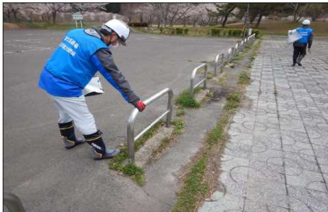
進入禁止柵 点検状況(七ヶ宿自然休養公園)