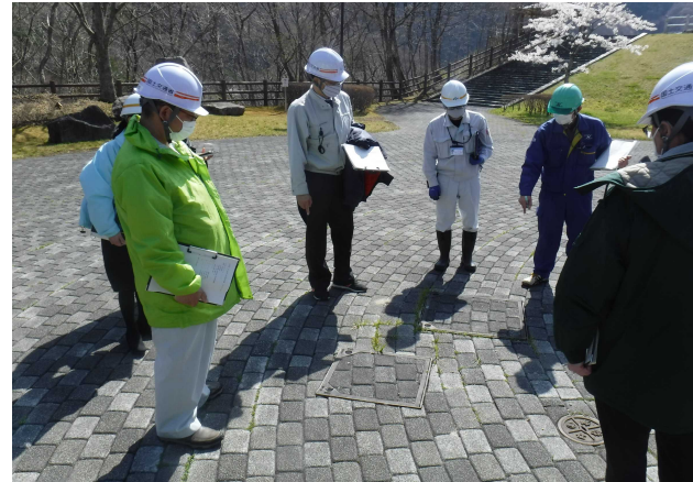
ダム展望公園 点検状況(ダム左岸公園)