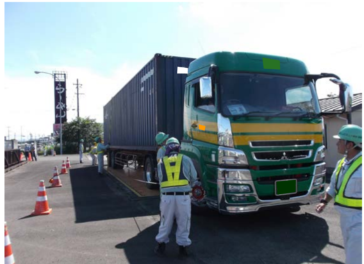
特殊車両の寸法測定状況