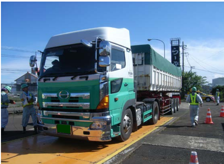
特殊車両の重量測定状況