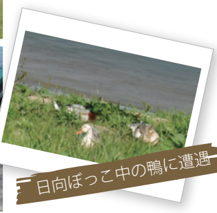
日向ぼっこ中の鴨に遭遇