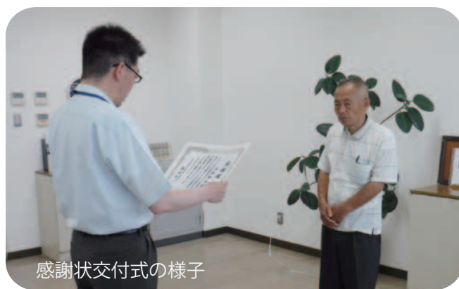
感謝状交付式の様子