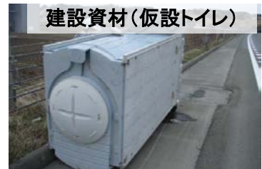
建設資材(仮設トイレ)