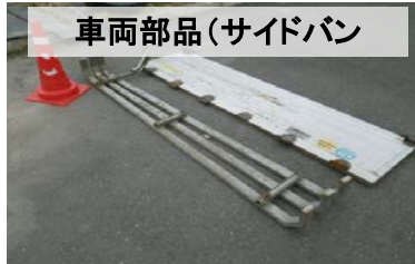
車両部品(サイドバン)