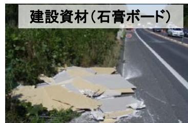
建設資材(石膏ボード)