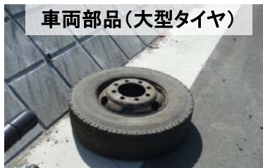
車両部品(大型タイヤ)