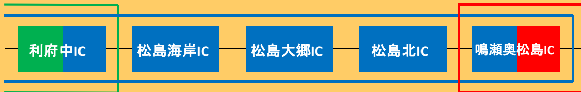
宮城県道路公社管理区間