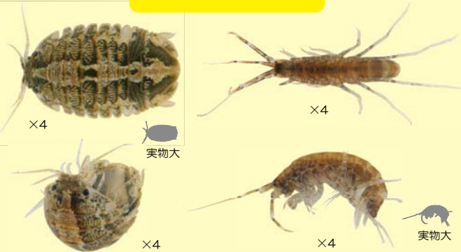
イソコツブムシ類