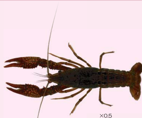
アメリカザリガニ