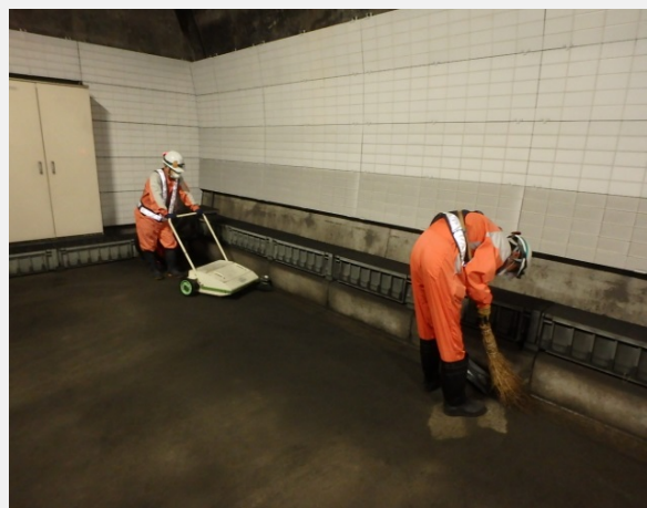
▲ トンネル内部清掃