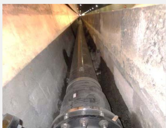
▲ 消火用配管本管設置