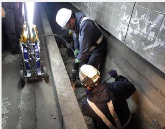
▲ 構造物撤去(人力破碎状況)