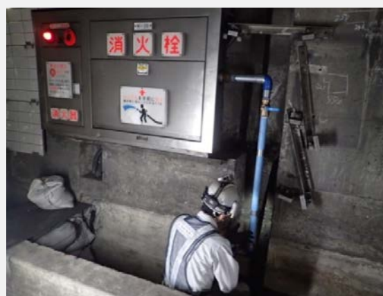
▲ 消火用配管立上り部設置