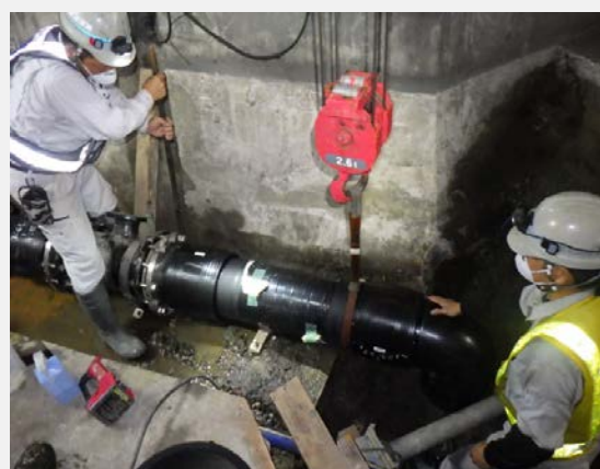
▲ 送水管設置・接合