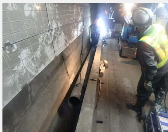
▲ 構造物撤去(鋼管撤去)