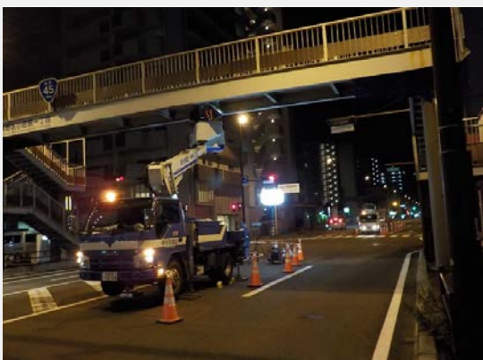
▲ 歩道橋 設備点検・補修