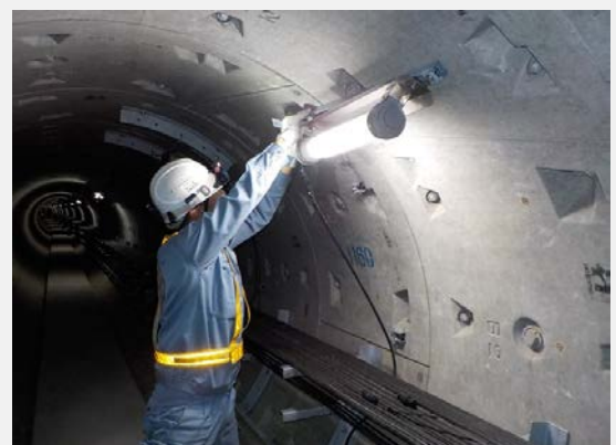
▲ 共同溝内照明灯交換