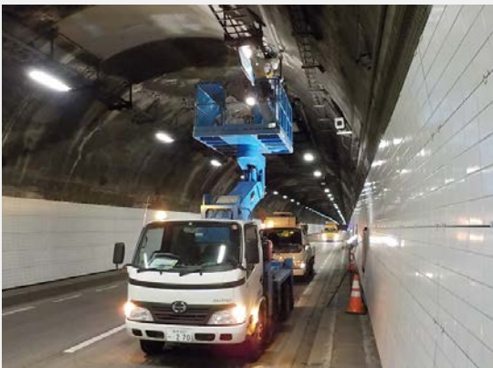
▲ トンネル内照明灯交換