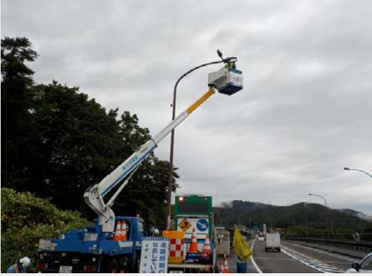
▲ 照明灯ランプ交換