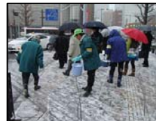
凍結抑制剤の散布