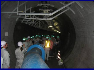
仙台共同溝（勾当台）