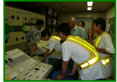
仙台西道路管理所監視室