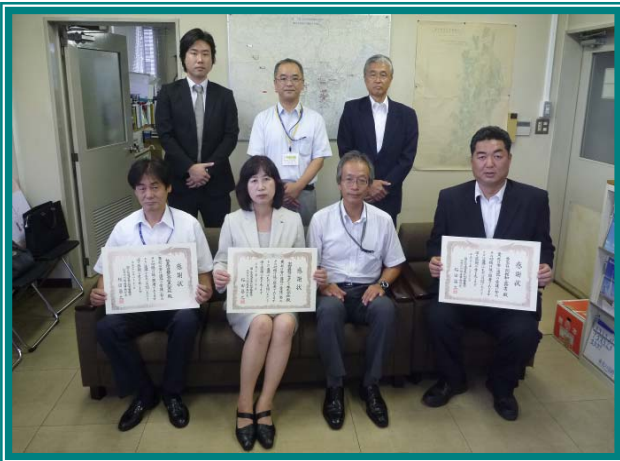
表彰式の様子 (仙台西国道維持出張所にて)

～西国道管内の表彰団体～ 能美防災株式会社東北支社 株式会社阿部和工務店 中野建設コンサルタント株式会社