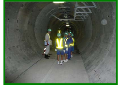
仙台共同溝（勾当台）