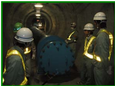
仙台共同溝（勾当台）