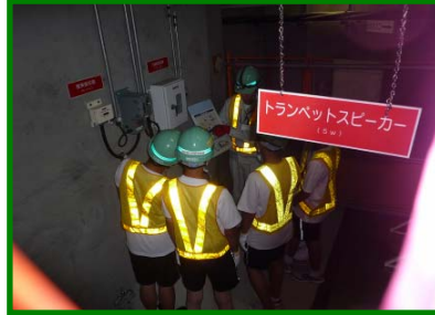
仙台共同溝（勾当台）