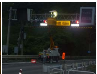
灯火標識の点検状況