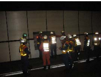
消防署による点検状況

内容は、路面の補修、道路清掃、管理設備の点検、スプリンクラーの水噴霧、各機関による通報試験等を、道路管理者、警察、消防機関、工事関係者、占用関係者など15団体約130名による一斉点検です。仙台西道路の安全な通行のための大規模点検、今年も無事終了しました。