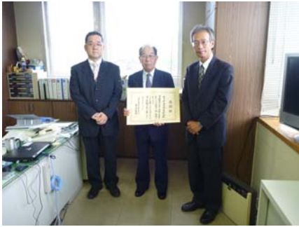
【東北地方整備局長表彰】 48号作並道路愛護会

8月20日、管内で活動を行っている道路愛護団体に対して感謝状を贈呈しました。これは道路ふれあい月間関連行事の1つで、道路の清掃・美化など道路愛護に顕著な功績があった団体を表彰するものです。今年度西国管内では、3団体が表彰されました。