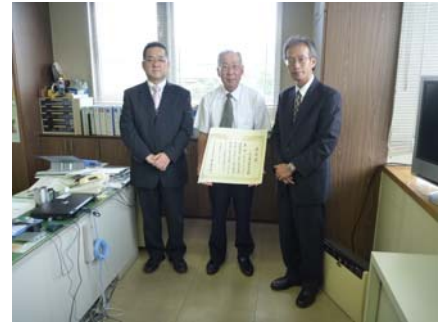
【道路功労者表彰(日本道路協会)】 山上清水町内会