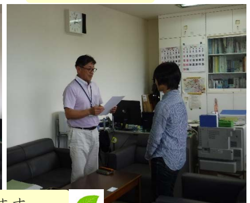
委嘱状交付：1年間よろしくお願ひします