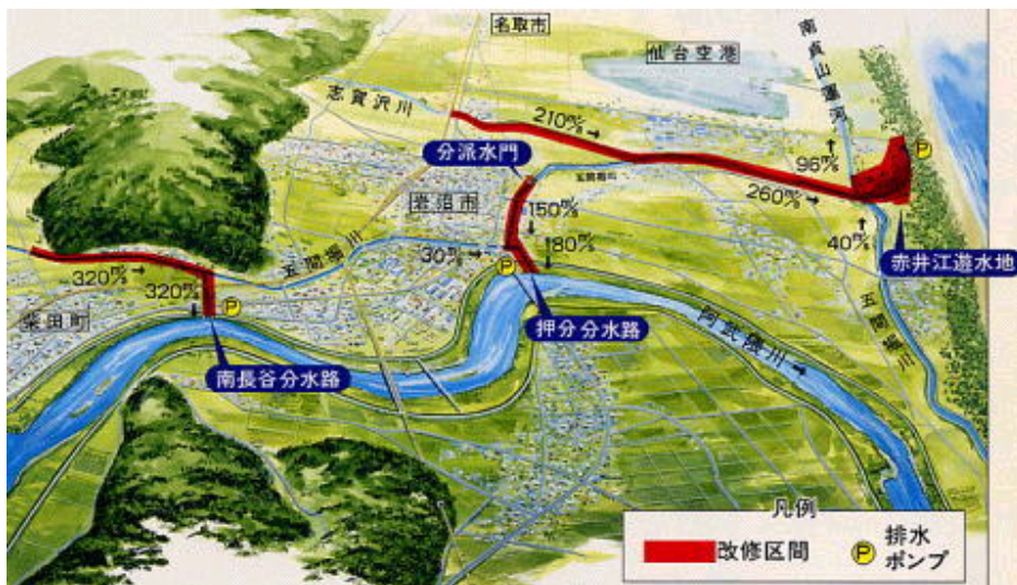
五間堀川の治水計画概要図

これらの治水対策により、貞山運河への負担は大きく軽減されるため、貞山運河については、現存の姿で保全していきます。