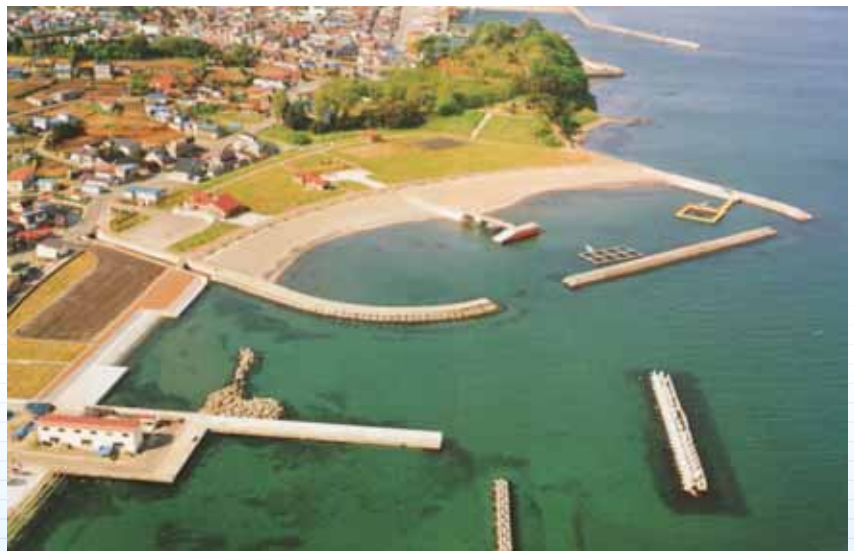
青森県 脇野沢漁港海岸