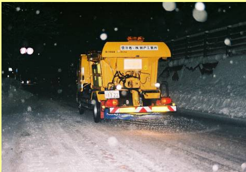
除雪（凍結抑制剤散布）