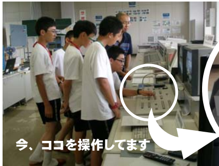
今、ココを操作してます