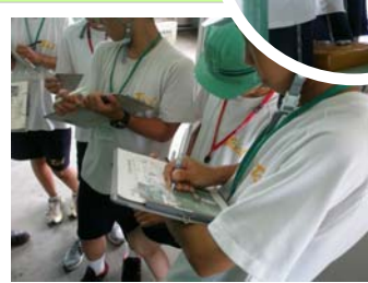
配管からの油もれ点検

みんな、説明に耳を傾け、熱心にメモを取りながら、点検を行ってくれました。短い時間でしたが、この体験がみんなの進路選択のヒントになってくれたら嬉しいです。