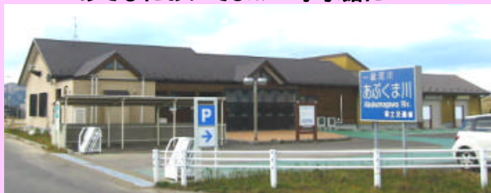
学水館あぶくま「岩沼館」

「学水館あぶくま」は仙台河川国道事務所、調査第一課で運営しています。「岩沼館」と「角田館」があり、「岩沼館」については岩沼出張所が、その運営をお手伝いしております。学水館では、阿武隈川のことを楽しく、詳しく勉強することができます。阿武隈川の河川探索の基地として利用できます。定期的にイベントを行います。をモットーに、休館日の毎週月曜日と年末年始を除き、土曜日と日曜日にも開館しています。ぜひ、遊びにお出でください。アテンダント(日本語では、案内人)三人娘(全員が既婚です)が明るく丁寧にご案内致します。