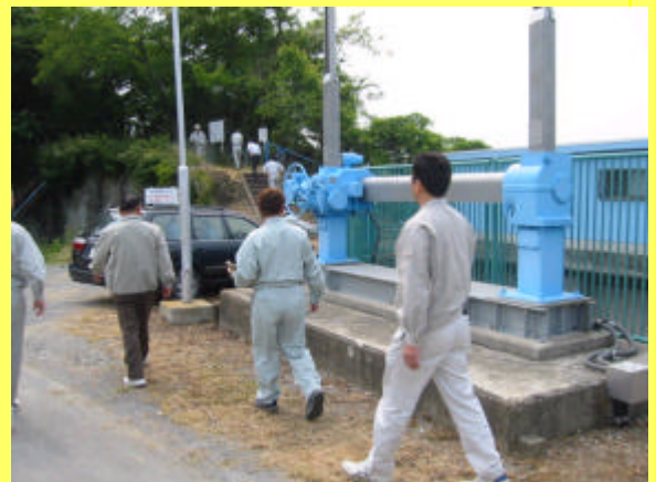
(岩地蔵取水口と亶理町上水道付近)