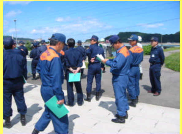
(東北本線鉄道橋と国道349号白幡橋付近)

また、6月1日には、直轄の排水樋管や水門等について、確実にゲートの開閉が出来るかを機械担当の職員と点検し、来る出水期への備えを新たにしました。