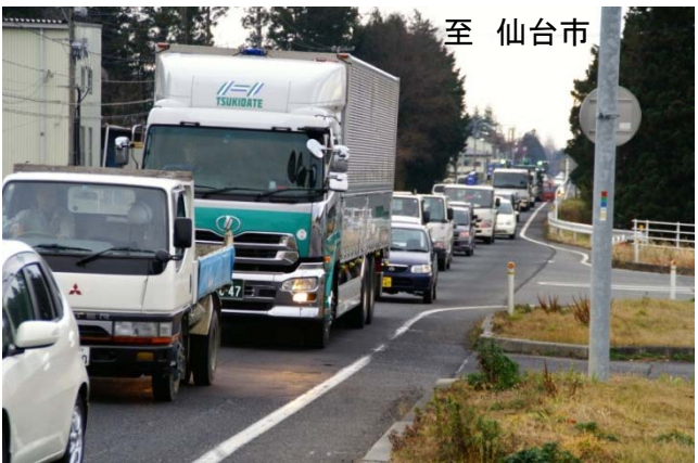
▲国道4号大衡地区の混雑状況