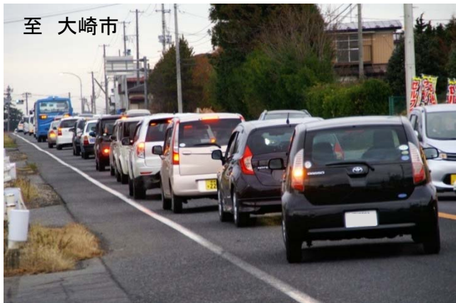
▲国道4号大衡地区の混雑状況